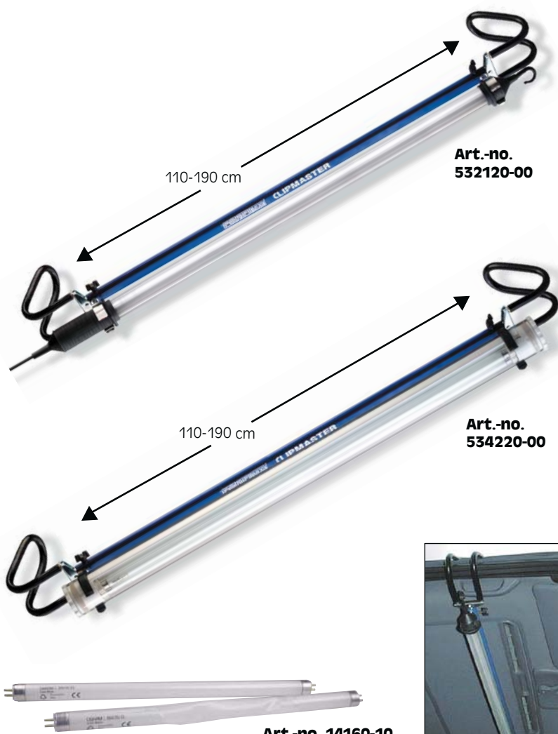
Art.-no. 14160-10 (21 Watt) Leuchtmittel mit Splitterschutzfolie Fluorescent covered with splinter protection foil Fluorescente couvert par feuille de protection Fluorescente cubierta con hoja de protección